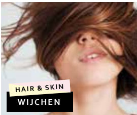
HAIR & SKIN WIJCHEN

Van Welderenstraat 71 6511 MD Nijmegen Telefoon: (024) 360 31 10