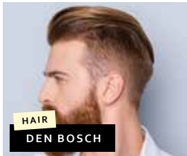
HAIR DEN BOSCH

Elckerlycweg 20 6602 HJ Wijchen Telefoon: 024-6419190