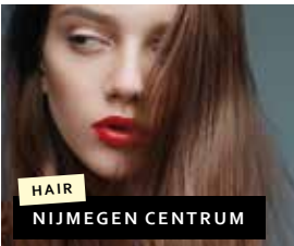
HAIR NIJMEGEN CENTRUM

Hertog Eduardplein 4 6663 AN Nijmegen – Lent Telefoon: 06-26791283 Van der Valk Hotel Nijmegen – Lent