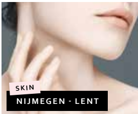
SKIN NIJMEGEN - LENT

Ieder mens bezit een individuele innerlijke en uiterlijke schoonheid. Die willen wij graag onderstrepen. Wij kijken goed naar jou, onze klant: gezichtscontouren, ogen, maar ook uitstraling en huidkwaliteit. Individueel advies en samen tot een uitgebalanceerde diagnose komen om vervolgens jouw kapsel en huidconditie aan te passen aan je persoonlijke wensen, dat is onze specialiteit. In onze salon in Wijchen zijn wij ook gespecialiseerd in het aanbrengen van permanente make-up.